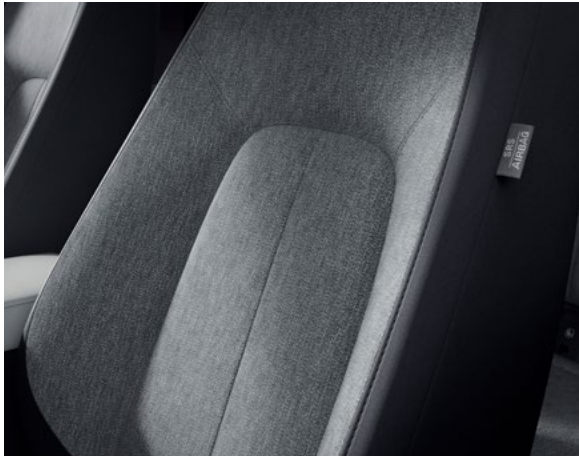
Interiøret i Mazda MX-30 SKY