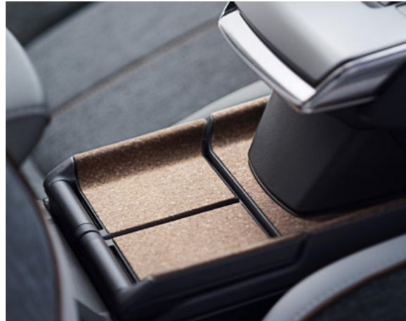
Indlæg i bæredygtigt kork er en hilsen til fortiden. Mazda blev grundlagt for 100 år siden som producent af netop kork.