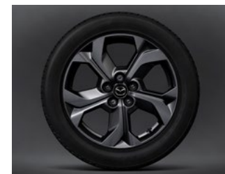
18" aluminiumsfælle (dæk 215/55R18) til MX-30 FIRST EDITION og COSMO