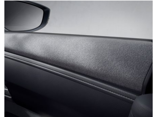
Det bløde materiale øverst og nederst på dørene er fremstillet af genbrugte plastikflasker.