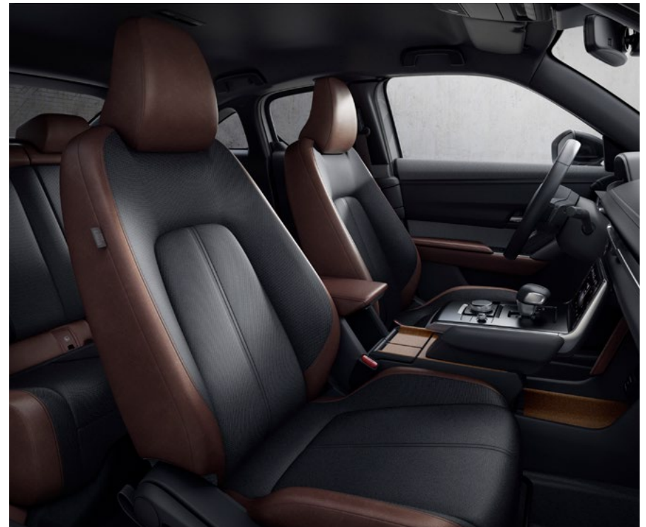
Interiøret i Mazda MX-30 FIRST EDITION og COSMO: Industrial Vintage