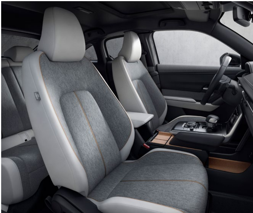
Interiøret i Mazda MX-30 FIRST EDITION og COSMO: Modern Confidence